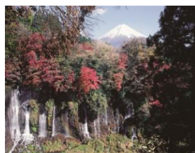
世界遺産・白糸の滝