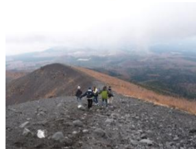
富士山トレッキング