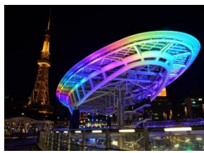
名古屋 オアシス21、テレビ塔