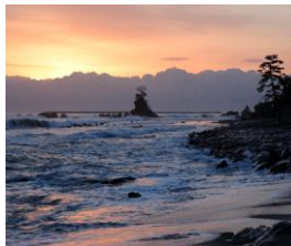
雨晴海岸からの立山連峰