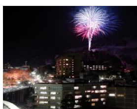
宇奈月温泉の花火