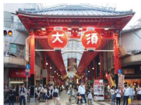
名古屋・大須商店街