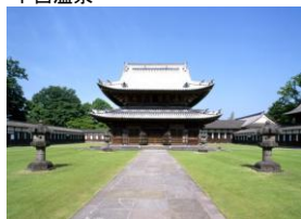
高岡・国宝瑞龍寺