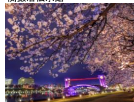
富山・富岩運河環水公園