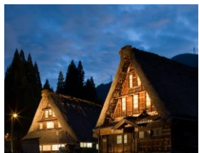
世界遺産・五箇山