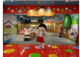
ちびまる子ちゃんランド