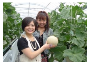
伊良湖・メロン狩