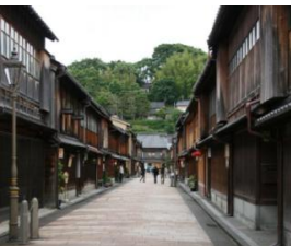
金沢・ひがし茶屋街