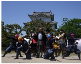
名古屋おもてなし武将隊