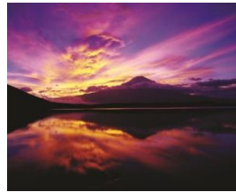
世界遺産・富士山