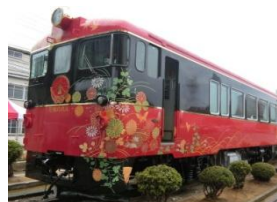
観光列車「花嫁のれん」