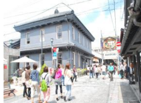
長浜・黒壁スクエア