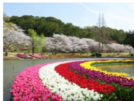
浜松フラワーパーク