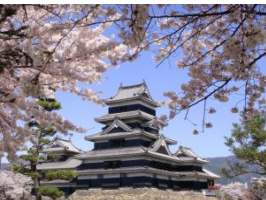
松本・国宝松本城