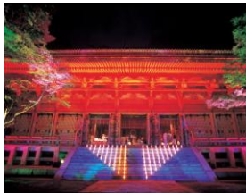
世界遺産・比叡山延暦寺