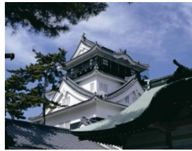
岡崎城(徳川家康生誕の地)