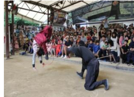
伊賀流忍者博物館