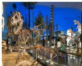
福井県立恐竜博物館