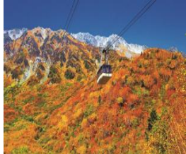
立山ロープウェイ