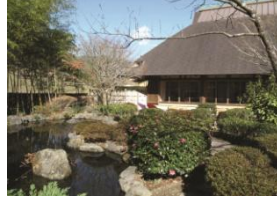
フォーレなかかわね茶茗館