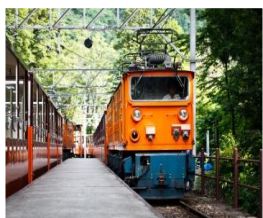
黒部峡谷トロッコ電車