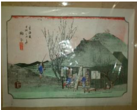
東海道広重美術館