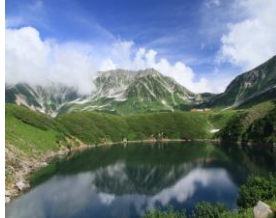
室堂・みくりが池