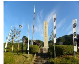
関ヶ原古戦場・決戦地