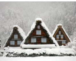
世界遺産・白川郷