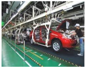
トヨタ会館／トヨタ自動車工場見学