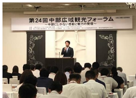
第24回中部広域観光フォーラム 「中部にしかない感動と魅力の発信」 (2018年8月大阪)