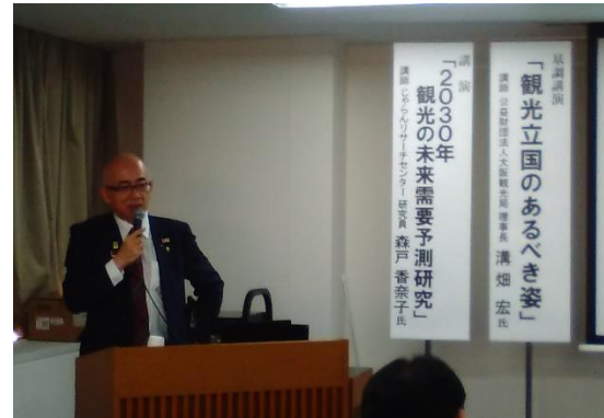
北経連共催セミナー 『観光立国のあるべき姿』 (2018年11月富山)