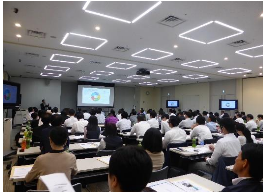
第3回インバウンドセミナー 『Googleデジタルマーケティング』 (2018年10月名古屋)