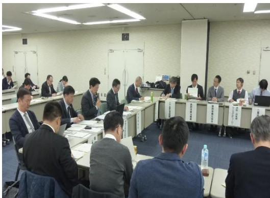
DMO連携委員会 (2018年12月名古屋)