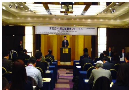
第25回中部広域観光フォーラム 「中部にしかない感動と魅力の発信」 (2018年11月東京)