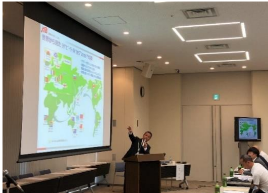
第2回インバウンドセミナー 『メガスポートイベントで誘客する！』『Googleデジタルマーケティング』 (2018年8月名古屋)