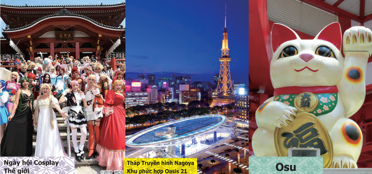
Ngày hội Cosplay Thế giới | Tháp Truyền hình Nagoya Khu phức hợp Oasis 21 | Osu